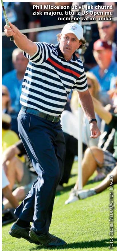
Phil Mickelson už ví, jak chutná zisk majoru, titul z US Open mu nicméně zatím uniká.

13.–16. června 2013, Merion Golf Club, Ardmore, Pensylvánie