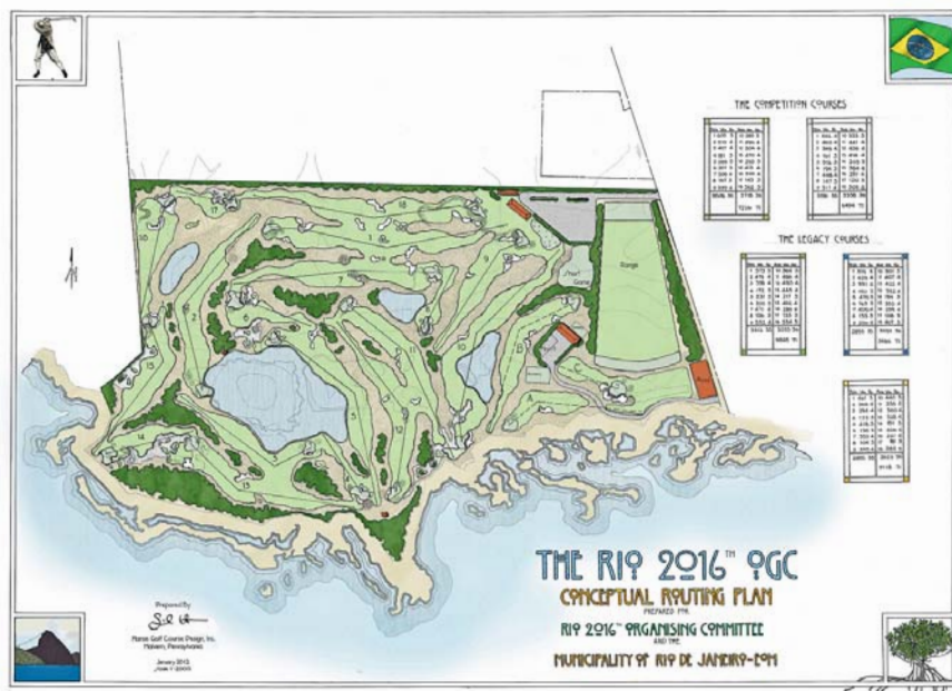
Plán olympijského hřiště

Zdrženlivost – to je to klíčové slovo, které si v těchto souvislostech pravidelně připomínáme.